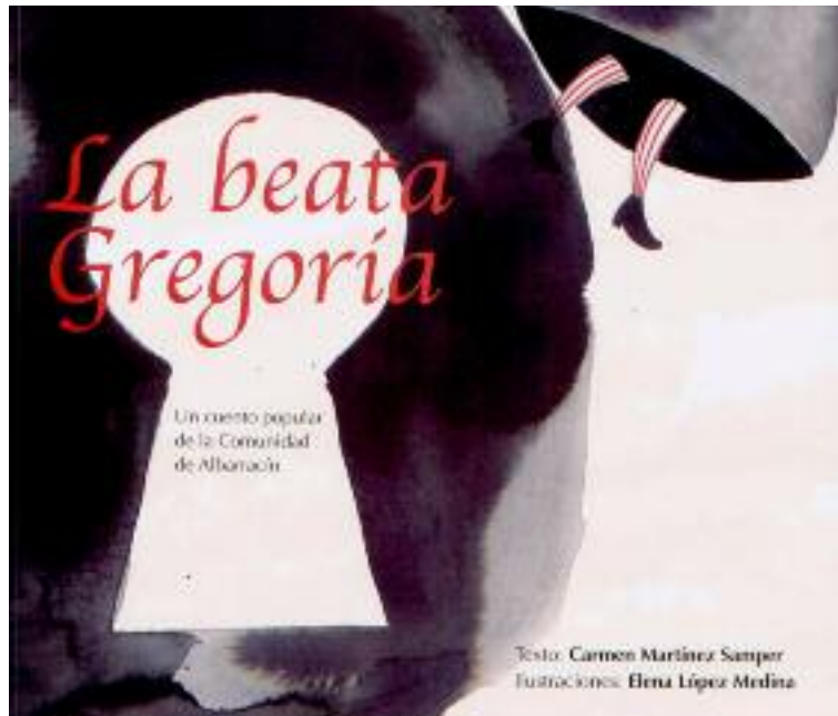
El cuento de "La beata Gregoria" aborda el papel de la mujer y sus aspiraciones

de la publicación viene de la mano tanto de la autora de las ilustraciones y el diseño como de la imprenta Perruca.