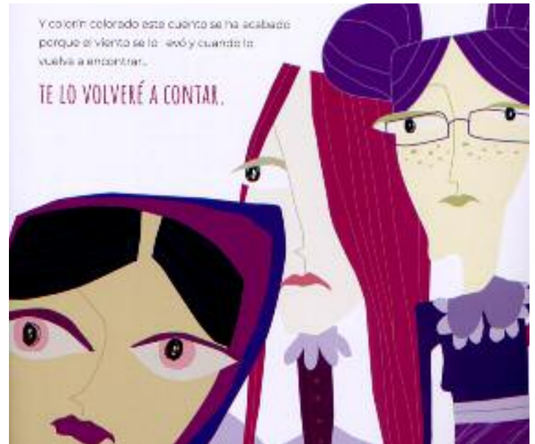
Los cuentos ilustrados son populares de la Comunidad de Albarracín adaptados

mo la inteligencia puede más que la fuerza y la corpulencia. "Los monstruos se pueden vencer y, con ello, también se puede contribuir a superar las dificultades de los otros. La recompensa llega y no tiene por qué ser material. Esta historia nos da pie a tratar temas de la naturaleza. En nuestro caso la fauna y los Montes Universales".