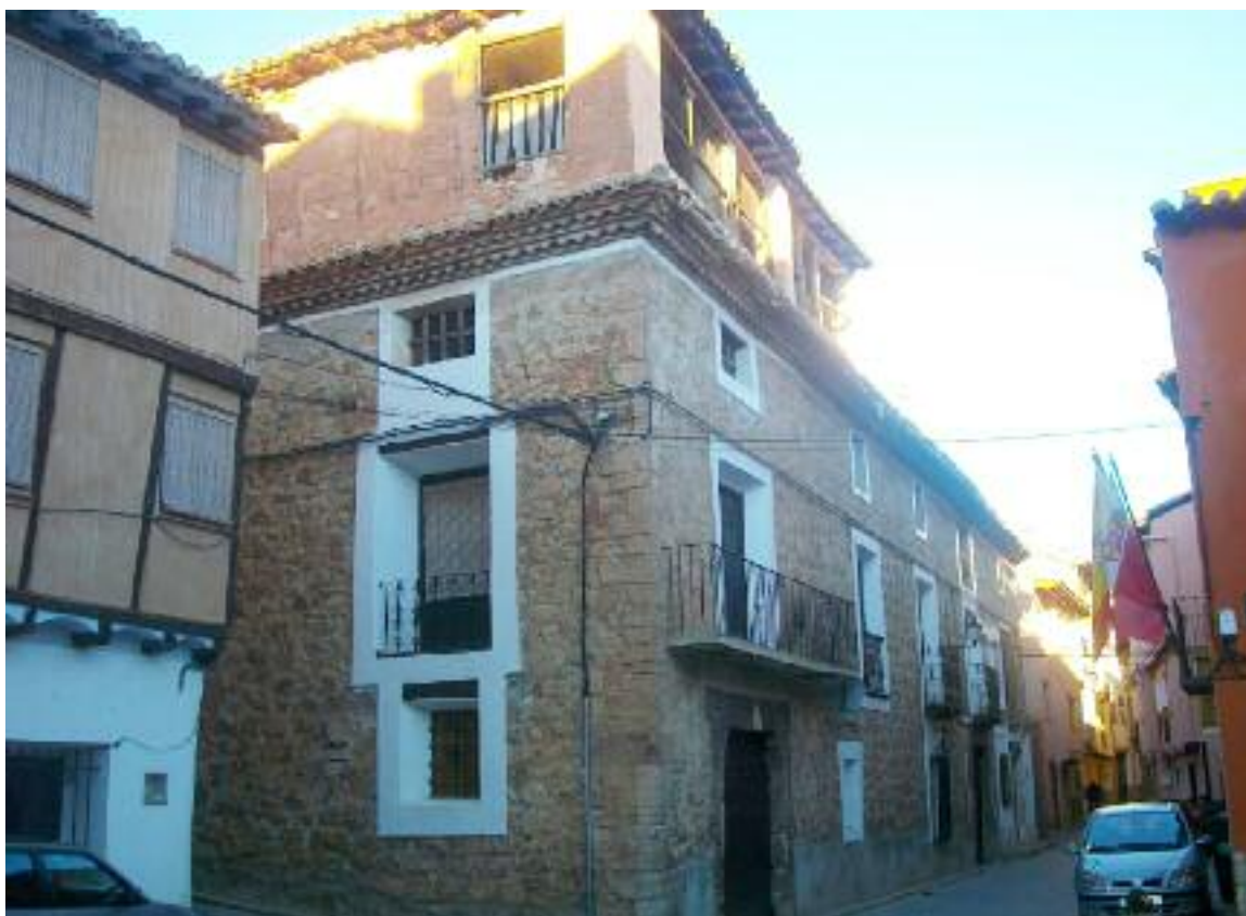
Casa de Manuel Polo y Peyrolón en Gea de Albarracín donde pasaba los meses estivales

Los organizadores quieren mostrar su interés en dar a conocer y divulgar al máximo el simposio sobre Manuel Polo y Peyrolón en los ámbitos universitarios y de investigación, pero también entre todo aquél que quiera acercarse y conocer todo lo relacionado con este escritor.