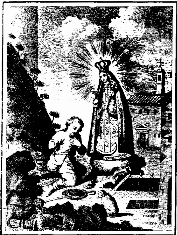
N.ª S.ª DEL TREMEDAL